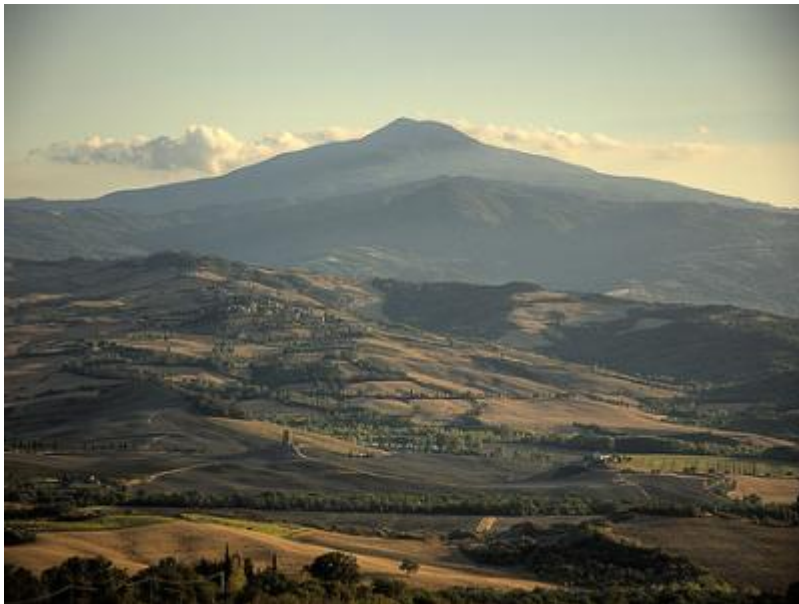
Una splendida vista del Monte Amiata

Le Elezioni amministrative sono alle porte. La campagna elettorale è partita ormai da un po', e ci troviamo – come sempre – alle prese con i nostri amministratori locali che dopo 5 anni di assenza totale, ora tornano alla carica promettendo sulla Geotermia tutto e il contrario di tutto.