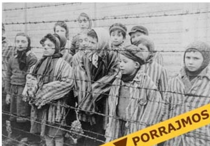
Bimbi Rom e Sinti in un campo di concentramento nazista

Domani è il giorno della memoria , con cui dal 2000 si celebra nel nostro paese l' Olocausto , termine – come si legge su Wikipedia – che «è stato introdotto alla fine del XX secolo per riferirsi al genocidio compiuto dalla Germania nazista di tutte quelle persone ed etnie ritenute “indesiderabili” (omosessuali, ebrei, oppositori politici, zingari, testimoni di geova, pentecostali, ecc...)».