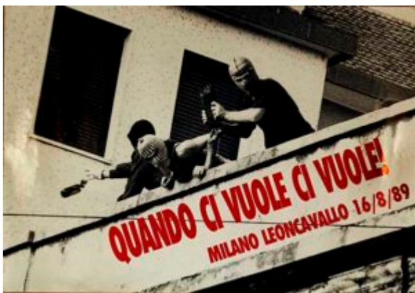
Lo storico Manifesto sullo sgombero del Leo dell'agosto '89