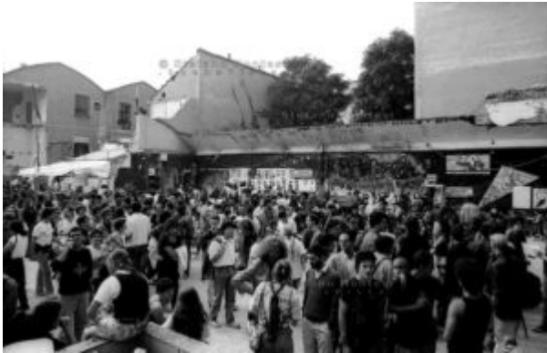
Milano Settembre 1989 Manifestazione in difesa del Centro Sociale Leoncavallo

2) È un bel romanzo, scritto bene, genuino, senza tante seghe e salamelecchi. Senza nascondersi, da vecchi a "erano ragazzate" o "si era giovani" o altre scuse per ripulirsi e rifarsi il trucco.