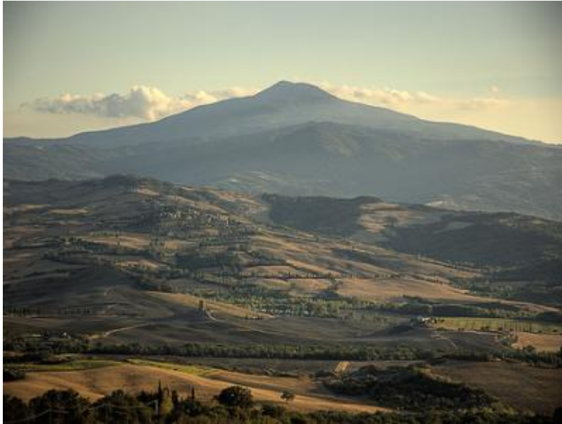
Una splendida vista del Monte Amiata

Le Elezioni amministrative sono alle porte. La campagna elettorale è partita ormai da un po', e ci troviamo – come sempre – alle prese con i nostri amministratori locali che dopo 5 anni di assenza totale, ora tornano alla carica promettendo sulla Geotermia tutto e il contrario di tutto.